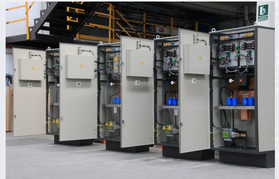
RK-AF7000—Personalizados a las peticiones del cliente.

Gracias a nuestro software -LYNX- se pueden crear diferentes segmentos de funcionamiento del rectificador pudiendo combinar rampas de subida y bajada, permanencias, ondas pulsantes, etc..