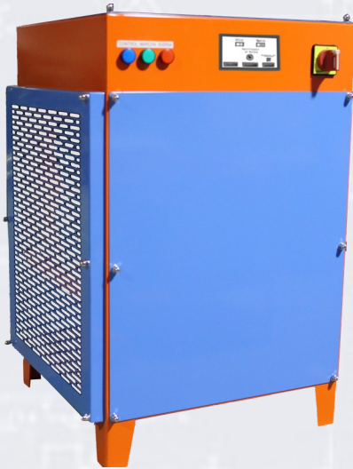
RK-AF7000—3.000A. – 15V.

RK-AF 7000 ha sido diseñado por el departamento técnico de RECMAN S.A. , ajustándose a las necesidades del mercado .